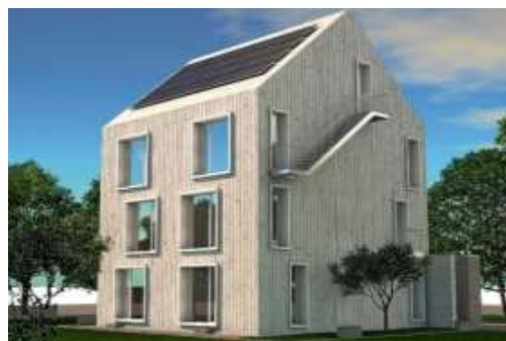
Generationenhaus Variante 2

il sistema innovativo di costruire clever – flessibile – carico per il futuro